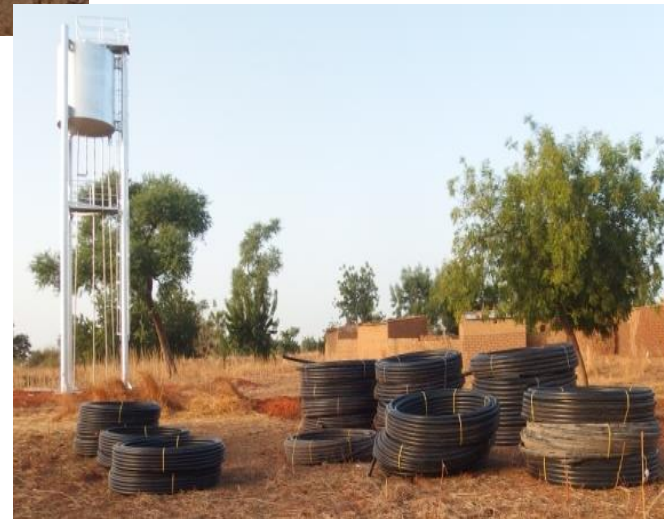
Pompe immergée Lorentz PE C-SJ5-25, 4Kw