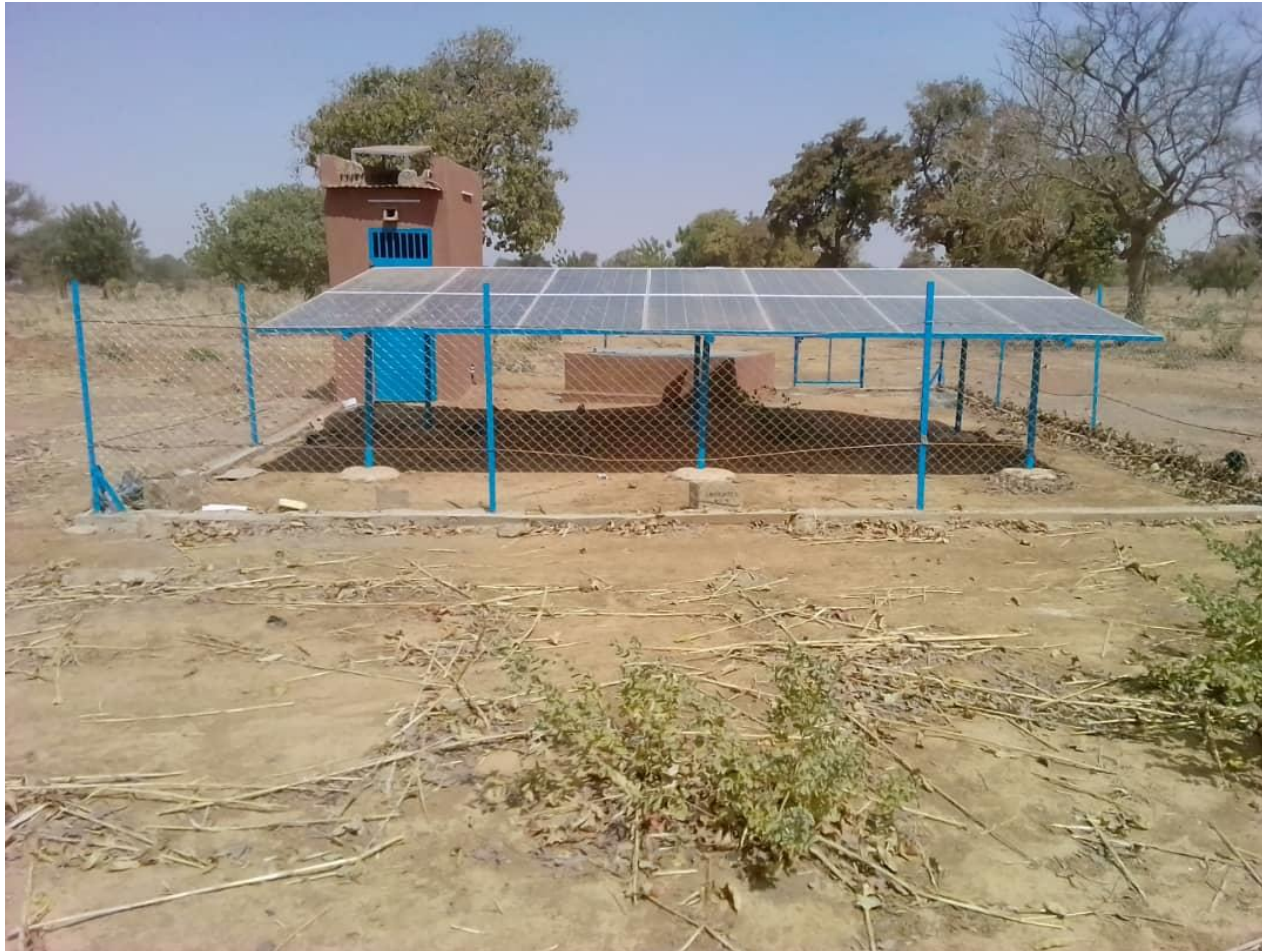
Pompage au fil du soleil