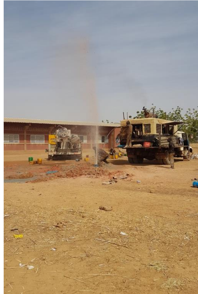
Action de foration en image